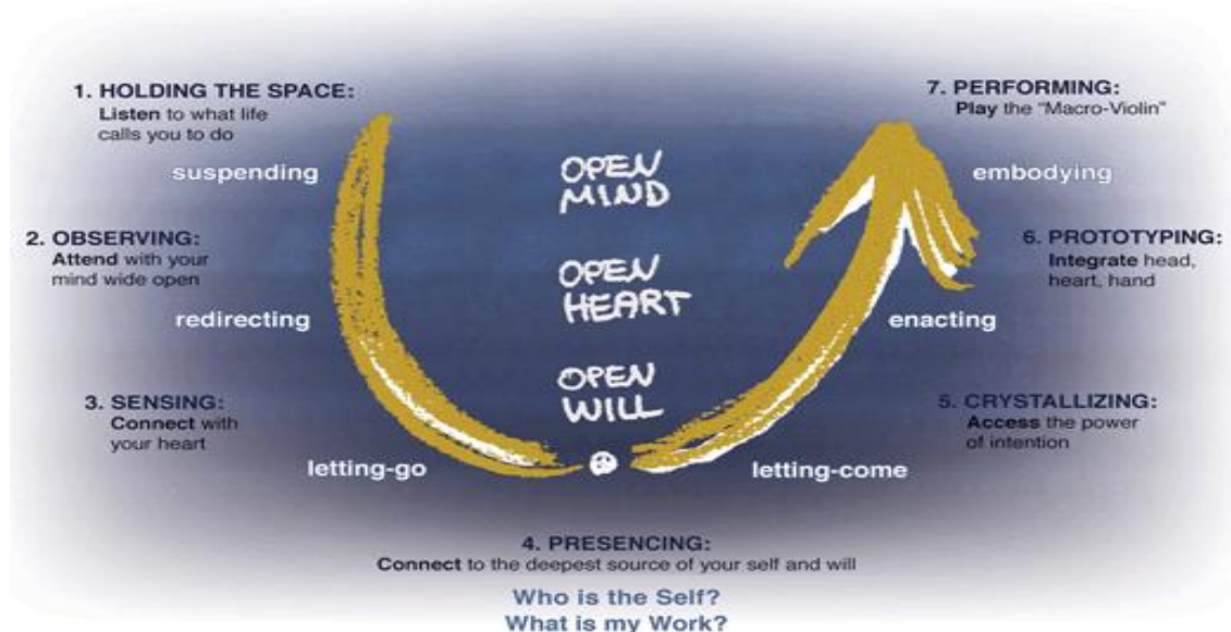
Figuur 1: Bouwstenen van duurzaam ontwikkelen (Uit Theory U van C.O. Scharmer)

Naast het aantal veranderingen neemt ook de complexiteit van de vraagstukken waarmee organisaties worden geconfronteerd steeds meer toe. Een “quick fix” is dan geen oplossing meer. Duurzaam ontwikkelen biedt een inspirerend ontwikkelpad naar een duurzame oplossing door op een andere manier naar de organisatie en zijn omgeving te kijken en te leren van de toekomst zoals die zich nu al aandient. Of zoals Einstein eens heeft gezegd: “fundamentele problemen kunnen niet worden opgelost met het zelfde niveau van denken dat ze heeft veroorzaakt”.